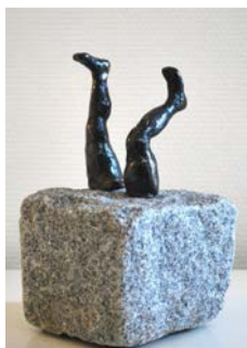
"Hvad mon der er på den anden side?"