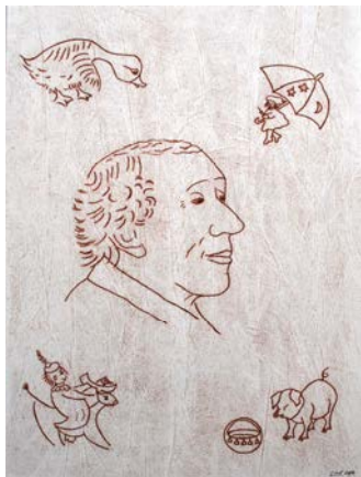
”H.C. Andersen får ideer”

Jeg arbejder primært, fordi jeg ikke kan lade være, men det jeg selv holder af, håber jeg også vil glæde andre.