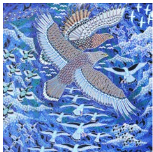
"Vingeslag over oprørt hav"