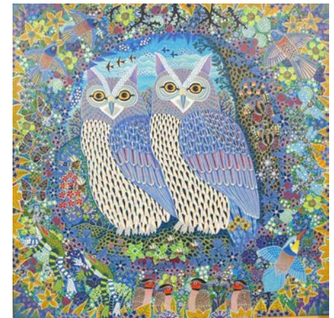
"Du som står og glør er kommet til billedet hvor uglen bor" .