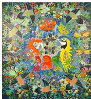
"Et kakafonisk familieportræt"